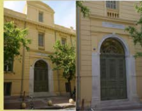
Η κεντρική είσοδος του σχολείου

Το κτίριο του 2ου ΓΕΛ Αθηνών βρίσκεται στη συμβολή των οδών Ακαρών και Χέυδεν. Χτίστηκε στα τέλη του 19ου αιώνα και φημιολογείται ότι οικοδομήθηκε σε προαχία του Ερνέστου Τσίλλερ. Πρόκειται για δύο κτίρια, τις επαύλεις των οικογενειών Ράλλη (γκρίζο κτίριο) και Αργυροπούλου (κίτρινο κτίριο). Στη Βίλλα Αργυροπούλου στεγάστηκε το 1932 το ιστορικό Β' Γυμνάσιο Αρρένων. Το 1973 το σχολείο μετατετάχθηκε σε άλλο κτίριο και το κτίριο της Χέυδεν εγκαταλείφθηκε. Από το 1990 το κτίριο τελούσε υπό κατάληψη μέχρι το 2016, οπότε ξεκίνησε η ανάσασή του από το Δήμο Αθηνών με ευρωπαϊκούς πόρους του ΕΣΠΑ 2007 - 2013. Παραδόθηκε σε 2 μόλις χρόνια και κατά το σχολικό έτος 2016 - 2017 λειτουργήσε ξανά ως 2ο Γενικό Λύκειο Αθηνών «Θεόδωρος Αγγελόπουλος».