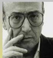
Ο σκηνοθέτης Θόδωρος Αγγελόπουλος, Απόφοιτος του σχολείου

Μου προκαλούσε βλίση το να βλέπω αυτό το κτίριο σε τέτοια άσχημη κατάσταση, κι έτσι χάρηκα όταν γίνει λικίο και στη πολύ πιθανόν να φοιτήσω εκεί, όπως και έγινε. Την πρώτη μέρα του σχολείου είχα τραμπερή περιέργεια και αγωνία να δω πως έκε γίνεται το εσωτερικό του κτίριου και πραγματικά είναι υπέροχο και συγκινητικό να βλέπω αυτό το κτίριο να ξαναβρίνει ζωή. ..Είμαι η Ηλέκτρα ..Είμαι από την Νοκρά ..Είμαι από την Ελλάδα ..Πήγανα στο Σπύριο ..Είπατε παιδιά, Είμαστε το ίδιο Νιάουμε το ίδιο. Εσύ γιατί μας αποκαλείς διαφορετικούς;