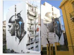
Graffiti του ΙΝΟ που αντικρίζει η αυλή του σχολείου

Το κτίριο του 2ου ΓΕΛ Αθηνών βρίσκεται στη συμβολή των οδών Ακαρών και Χέυδεν. Χτίστηκε στα τέλη του 19ου αιώνα και φημιολογείται ότι οικοδομήθηκε σε προαχία του Ερνέστου Τσίλλερ. Πρόκειται για δύο κτίρια, τις επαύλεις των οικογενειών Ράλλη (γκρίζο κτίριο) και Αργυροπούλου (κίτρινο κτίριο). Στη Βίλλα Αργυροπούλου στεγάστηκε το 1932 το ιστορικό Β' Γυμνάσιο Αρρένων. Το 1973 το σχολείο μετατετάχθηκε σε άλλο κτίριο και το κτίριο της Χέυδεν εγκαταλείφθηκε. Από το 1990 το κτίριο τελούσε υπό κατάληψη μέχρι το 2016, οπότε ξεκίνησε η ανάσασή του από το Δήμο Αθηνών με ευρωπαϊκούς πόρους του ΕΣΠΑ 2007 - 2013. Παραδόθηκε σε 2 μόλις χρόνια και κατά το σχολικό έτος 2016 - 2017 λειτουργήσε ξανά ως 2ο Γενικό Λύκειο Αθηνών «Θεόδωρος Αγγελόπουλος».